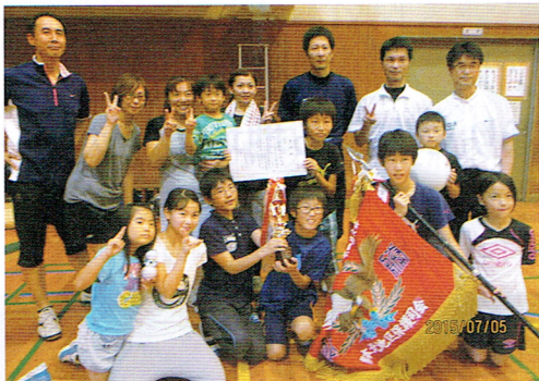
優勝した北部東小学校