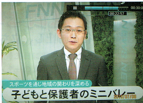
テレビニュースとして報道される