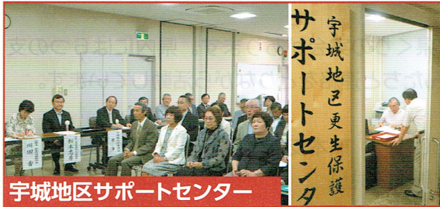
宇城地区サポートセンター

平成27年5月19日開所式を行い、企画調整保護司17名で取り組んでいます。 地域の安全、安心の為に関係団体と連携し貢献出来ればと思います。