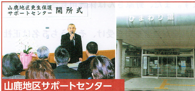
山鹿地区サポートセンター

元小学校の2階一室を借用 平成26年12月8日開所しました。 現在企画調整保護司14人体制で活動しています。