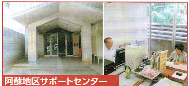
阿蘇地区サポートセンター

平成26年12月18日から、山鹿市菊鹿健康福祉センター（ひまわり館内）でサポートセンターを開設。 企画調整保護司9名で活動しています。