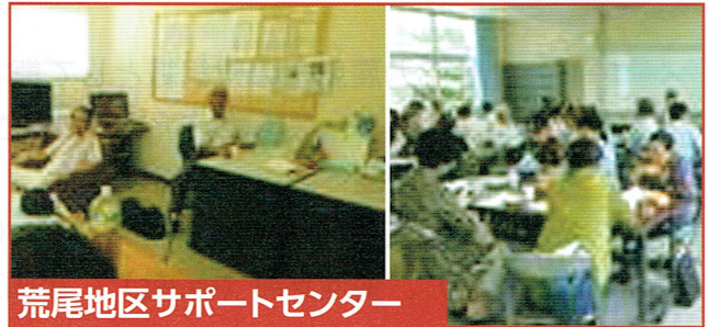
荒尾地区サポートセンター

平成27年5月19日開所式を行い、企画調整保護司17名で取り組んでいます。 地域の安全、安心の為に関係団体と連携し貢献出来ればと思います。