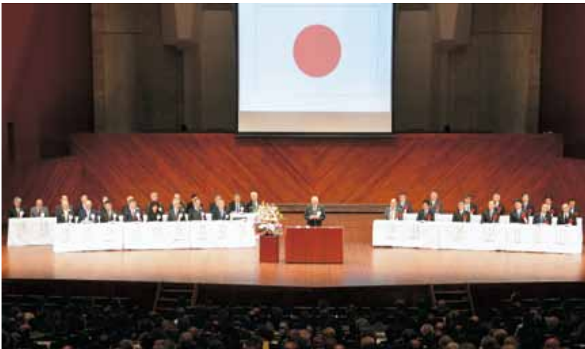
七十周年記念九州地方更生保護大会 更生保護制度施行七十周年記念九州地方更生保護大会が令和元年十一月十五日熊本市で開催されました。