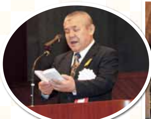
藤森九保連会長式辞

なお、大会において、保護司をはじめとする多くの皆様のお力をいただいたことに感謝申し上げます。